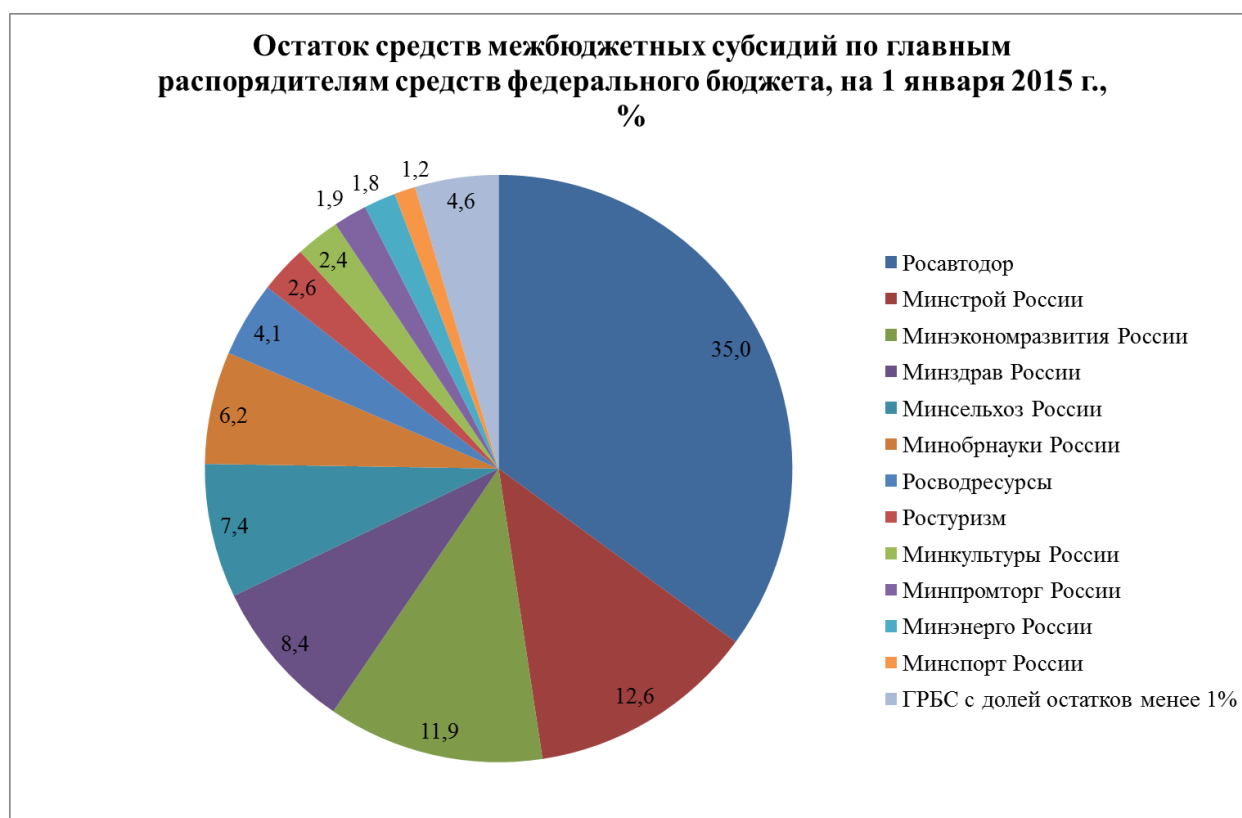
Рис.4. Остаток средств межбюджетных субсидий по главным распорядителям средств федерального бюджета, на 1 января 2015 г., %

Неиспользованные остатки средств субсидий характеризуются значительной концентрацией у отдельных главных распорядителей средств федерального бюджета. При этом существенную величину неиспользованных субсидий формируют «капитальные» субсидии.