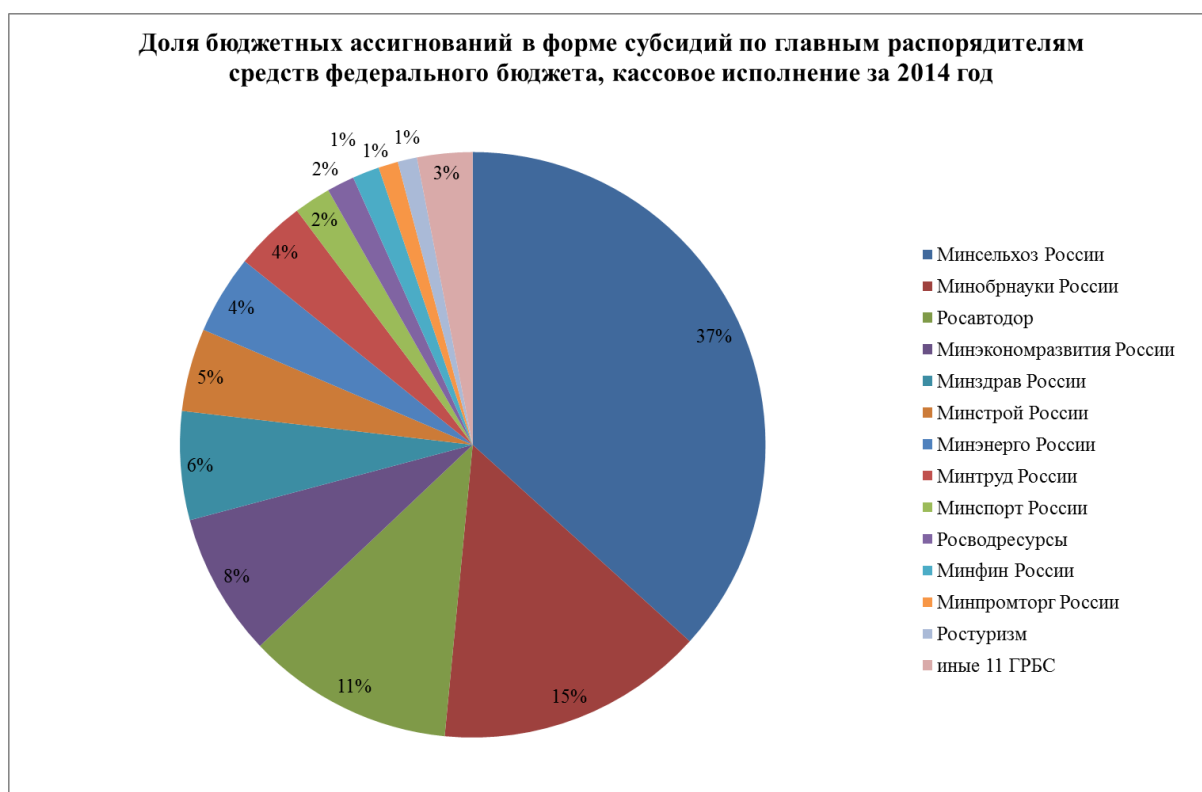
Рис. 2. Доля бюджетных ассигнований в форме субсидий по главным распорядителям средств федерального бюджета, кассовое исполнение за 2014 год

Кроме того, низкий уровень кассового исполнения отмечался по «капитальным» субсидиям Минтруда России (не профинансировано 72,1% средств от утвержденного лимита) и Минпромторга России (не профинансировано 58,8% средств от утвержденного лимита).