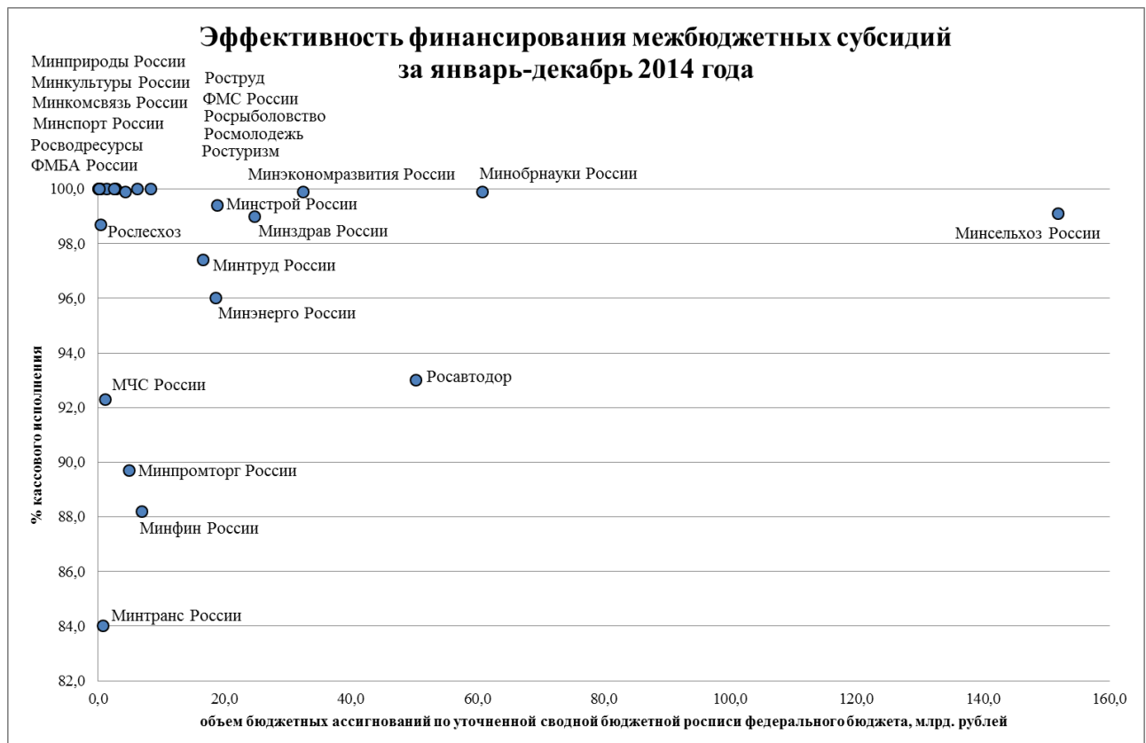
Рис. 1. Эффективность финансирования межбюджетных субсидий за январь-декабрь 2014 года

80%-89,9% - 3 федеральных органа исполнительной власти (Минпромторг России, Минфин России, Минтранс России).