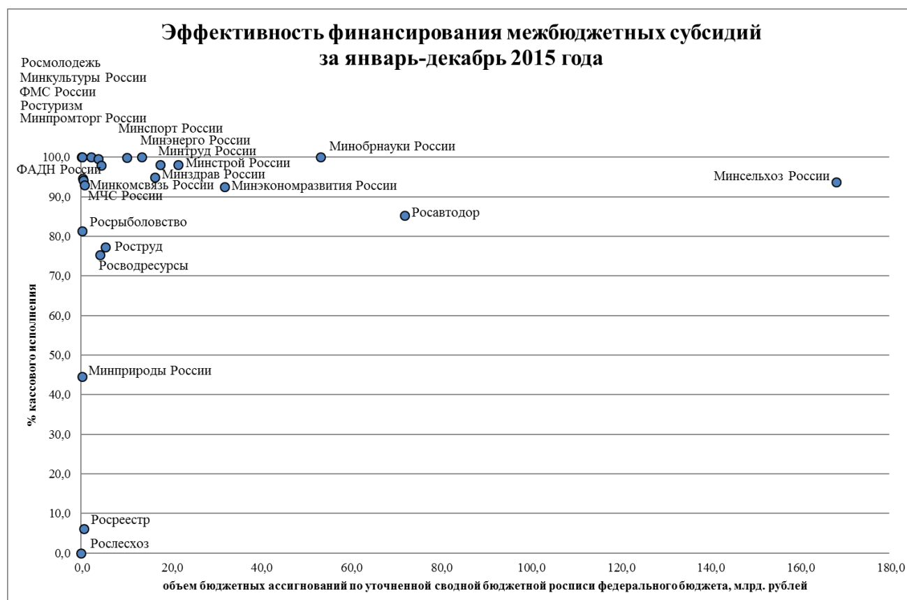
Рис. 1. Эффективность финансирования межбюджетных субсидий за январь-декабрь 2015 года

80%-89,9% - 2 федеральных органа исполнительной власти (Росрыболовство, Росавтодор).