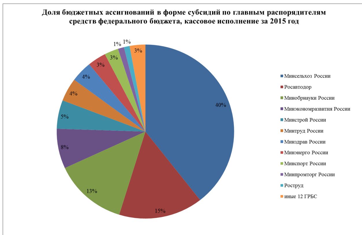
Рис. 2. Доля бюджетных ассигнований в форме субсидий по главным распорядителям средств федерального бюджета, кассовое исполнение за 2015 год

Также невысокий уровень кассового исполнения отмечался по «капитальным» субсидиям Росводресурсов (не профинансировано 22,6% от утвержденного лимита) и Минэкономразвития России (не профинансировано 14,1% средств от утвержденного лимита).